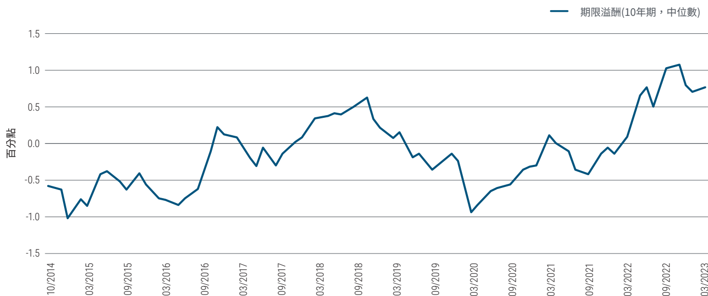
圖3：美國10年期公債的期限溢酬仍高，且預計增加

近幾年，雖然許多私募信貸資產的波動性低於公開發行市場，但我們不應掉以輕心。由於公開發行市場重新定價速度較快，我們認為高品質債券的風險回報會高於其他景氣敏感度較高的私募信貸。